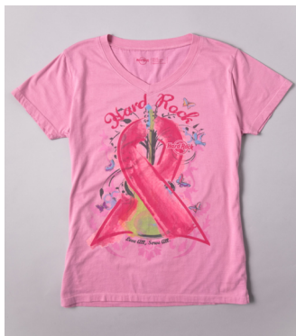
'10 Pinktober ® Breast Cancer Awareness T-Shirt