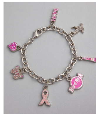
'10 Pinktober Bracelet